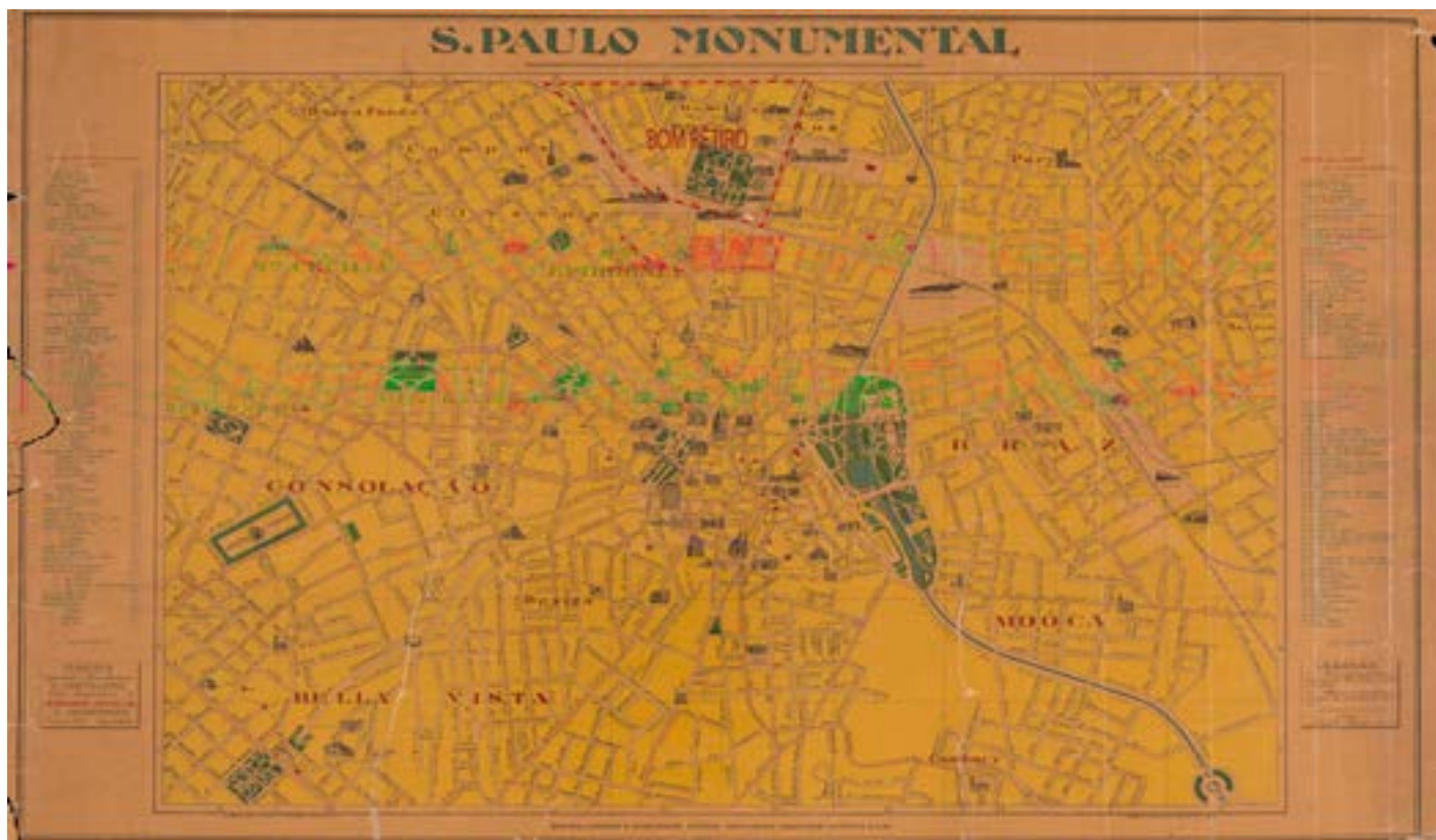
S.P. Monumental. Mapa organizado e desenhado por G. Castiglione.

Interessa-me desvendar outras dimensões nas transformações da centralidade paulistana, entorno da hipótese de que o centro passa por sucessivos processos de atualização e reafirmação de sua dinâmica, a partir do momento em que não mais é reconhecido como um território das elites. Para esta abordagem a indissociabilidade entre centro e bairros centrais é componente fundamental, assim como é fundamental problematizar