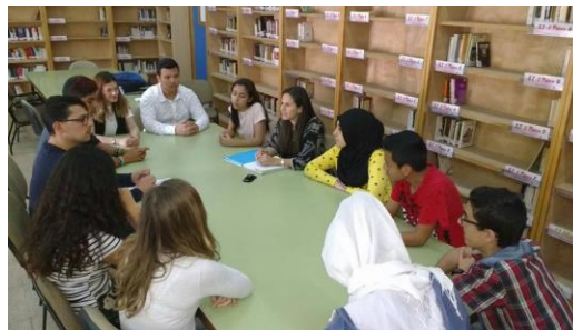
Grupos de discusión con estudiantes de secundaria de la Región de Murcia. Centro Diego Tortosa (Cieza)

Las acciones dirigidas a los estudiantes de secundaria forman parte de un proyecto piloto que se está desarrollando exclusivamente en la Región de Murcia.